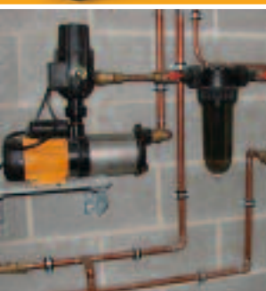
NW 18 Ø 3/4"