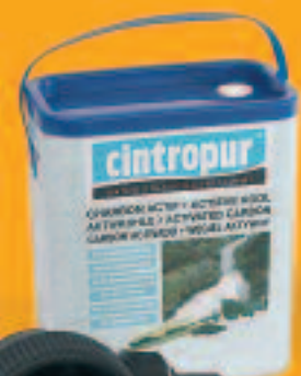
NW 25 TE + Aktivkohle

Die hohe Anzahl der Poren und die große Kontaktfläche machen unsere Aktivkohle zu einer exzellenten Wahl für die Verbesserung des Geschmacks, das Entfernen von Gerüchen, das Vermindern des Chlorgehaltes, des Ozons und der Verunreinigungen wie Pestizide und andere organischen im Wasser befindlichen Substanzen.